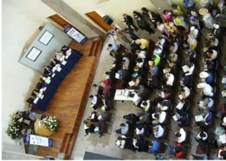
Audiencia Pública de Juzgamiento México, 2006. Vista panorámica del público y el jurado.

Bolivia; la afectación del santuario del Río Las Cruces en Chile, la afectación de la Cuenca Lerma-Chapala-Pacífico en México; el caso del proyecto hidroeléctrico La Parota en Guerrero, México o la vulneración de sistemas hídricos en Centroamérica por la expansión de la minería a cielo abierto.