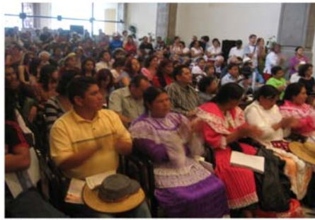
Audiencia Pública de Juzgamiento México, 2006. Vista general del auditorio de sesiones y público en general.

Después de esta experiencia exitosa, el Tribunal Latinoamericano del Agua realiza otras Audiencias Internacionales en Guadalajara, México, en el 2007 y en Antigua Guatemala en el 2008 en las que convergen 17 casos relacionados con problemáticas hídricas de Latinoamérica.